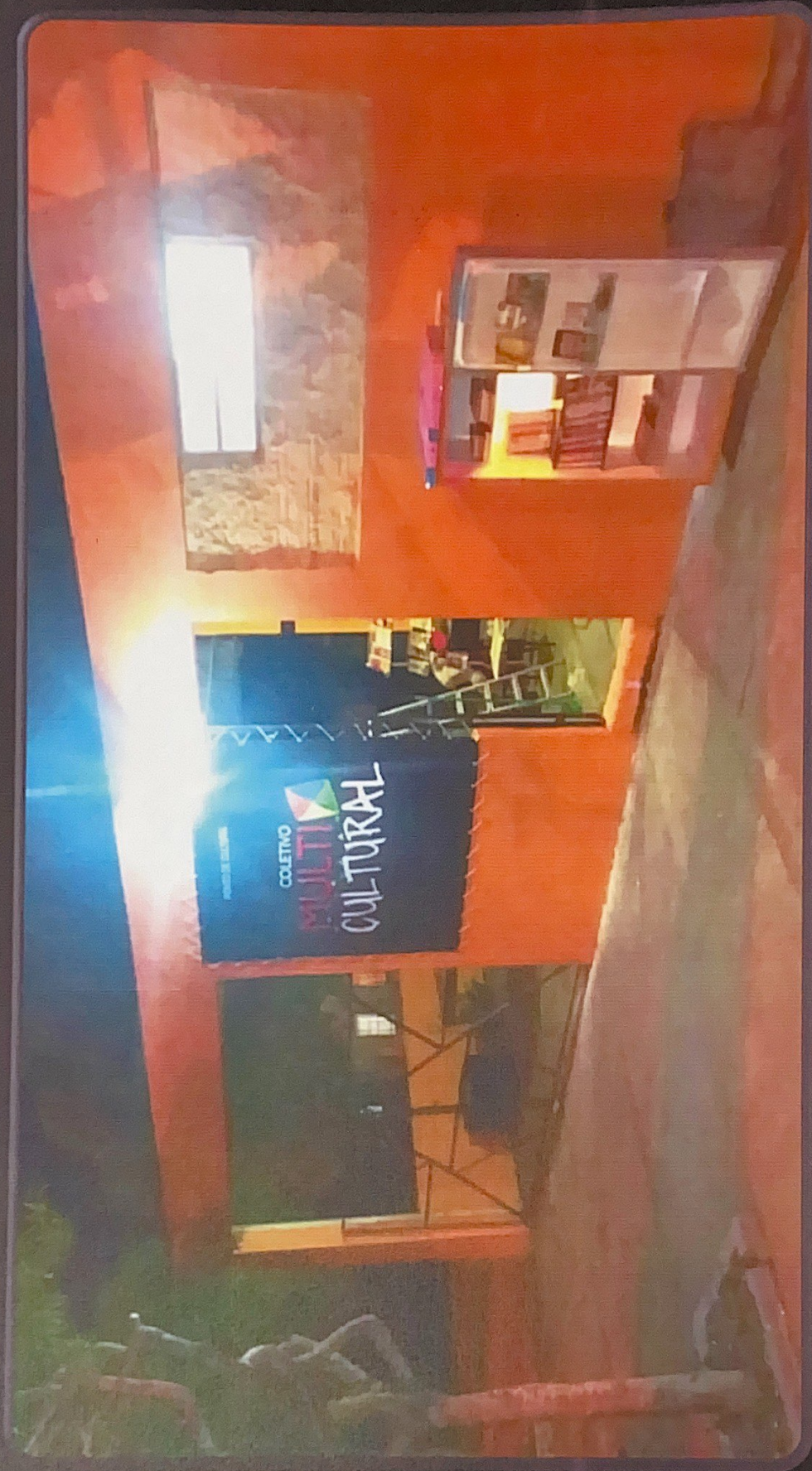
Espaço Atual – Localizado na rua Maximino Marinho, 270