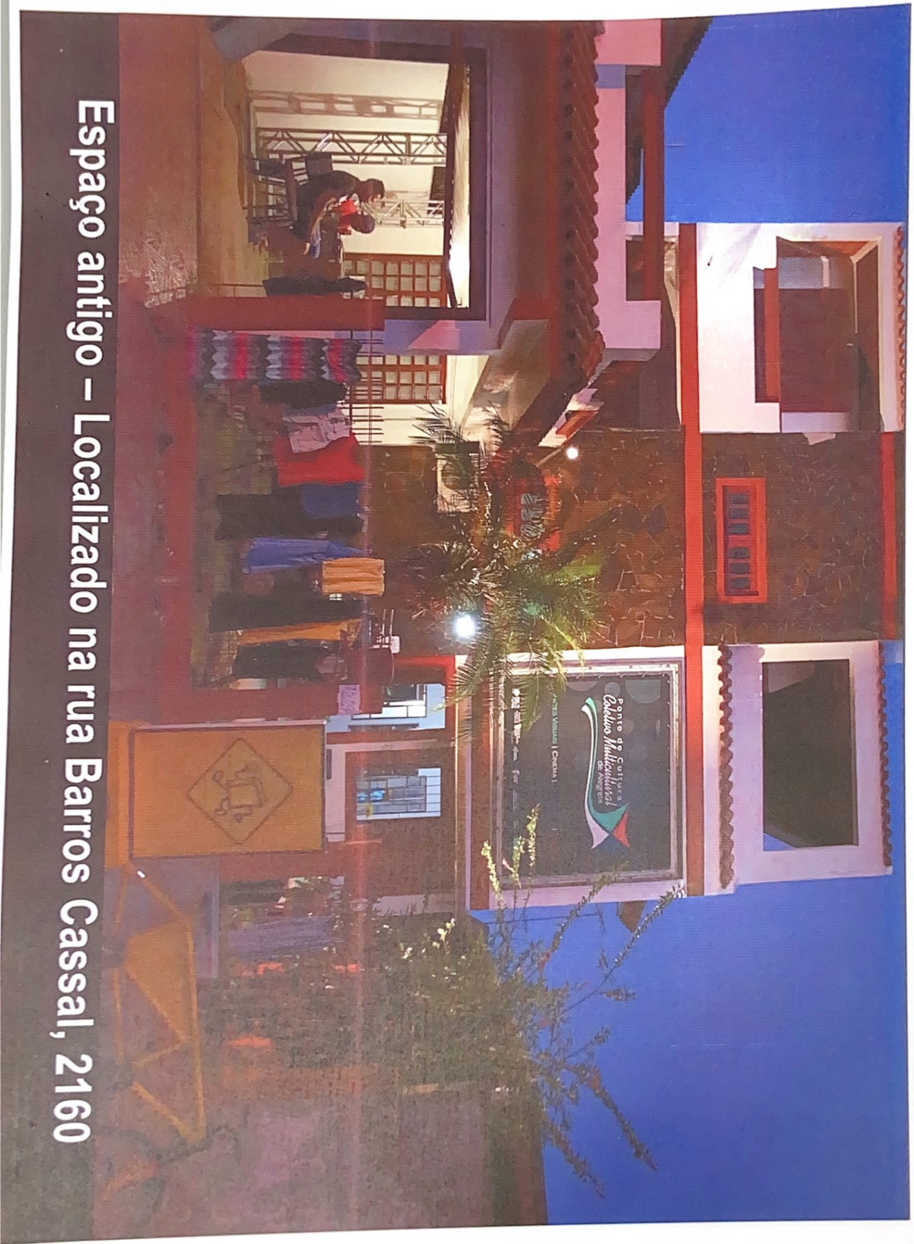
Espaço antigo – Localizado na rua Barros Cassal, 2160